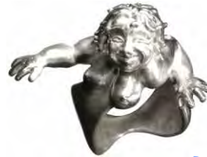
Ring Mama Terra Silber € 340,-