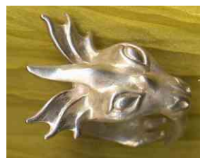
Ring Der Weise Silber € 250,-