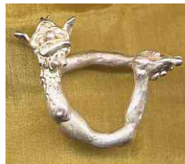
Ring Fachan Silber € 290,-