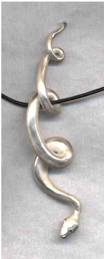
Anhänger Schlängelnde Schlange Silber € 330,-