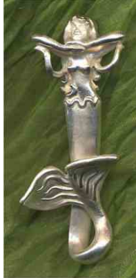
Anhänger Enjoy! Silber € 220,-