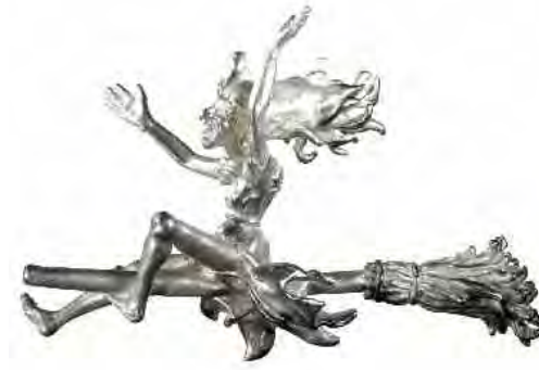
Anhänger Kräuterhexe Silber € 360,-