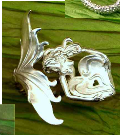
Ring Open Heart Silber € 340,-