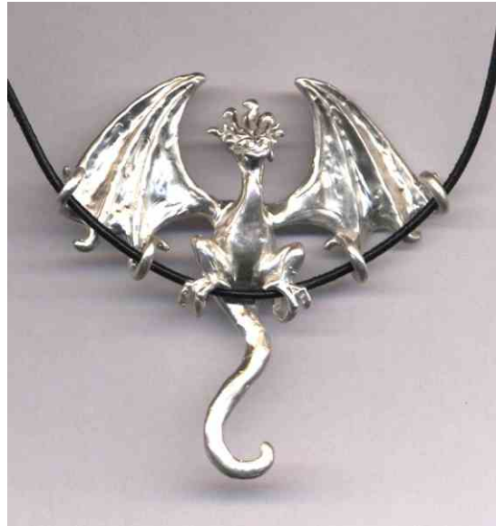
Anhänger Drach Kasigemo