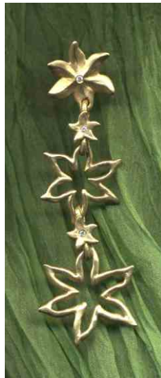
Ohrhänger Sternenblume siehe bei Sonne, Mond und Sterne