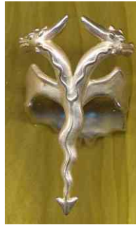
Ring Doppelköpfiger Drache Silber € 260,-