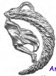
Anhänger Mondgeflüster Silber € 260,-