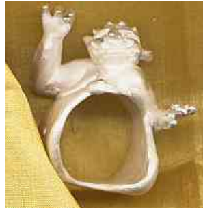
Ring Stumpfsine Silber € 320,-