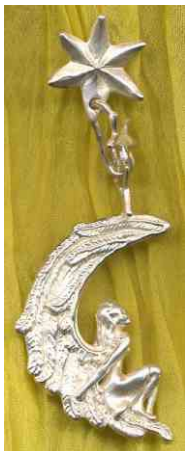
Ohrhänger Mondengel Silber € 270,-