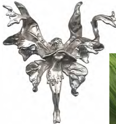
Anhänger Elfe Silber € 350,-