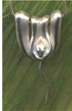
Anhänger Ruhepol Silber € 340,-