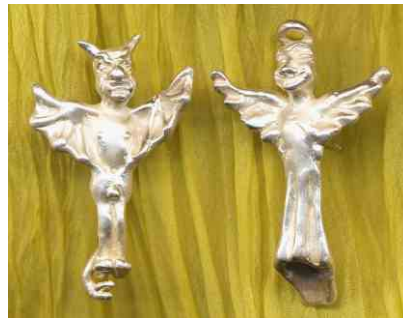
Ohrstecker Engel und Teufel Silber Paar € 380,-