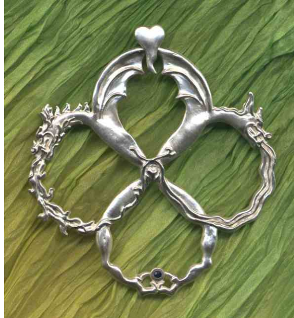
Anhänger Vier Elemente Silber mit Stein € 480,-