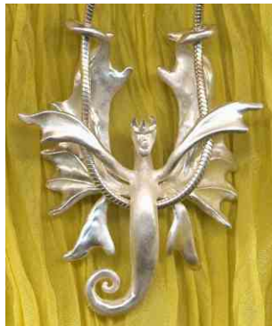
Anhänger Drachenelf Silber € 250,-