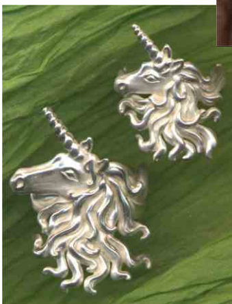
Ring Einhorn klein Silber € 230,-