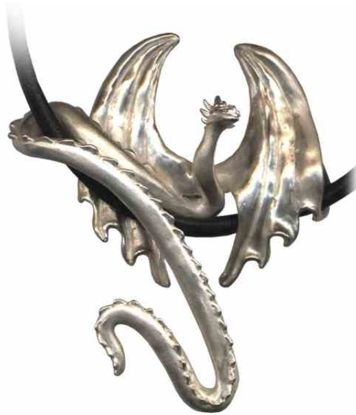
Anhänger In der Ruhe liegt der Drach Silber € 480,-