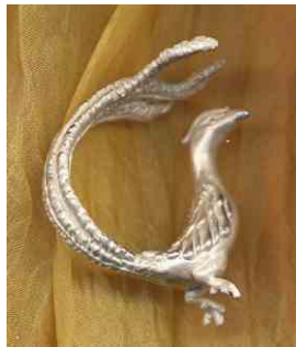
Ring Paradiesvogel Silber € 280,-