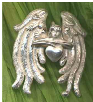
Anhänger Schutzengel Silber € 330,-