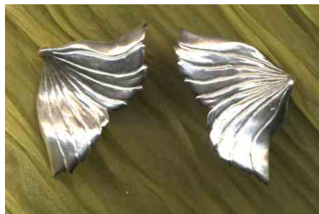
Ohrstecker Flosse Silber Paar € 290,-