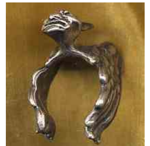
Ring Kind der Nacht Silber € 290,-