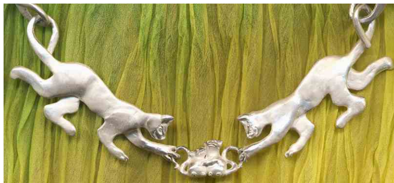
Collier Mäusefänger Silber € 950,-