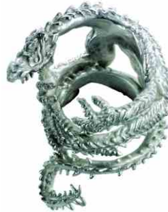
Ring Klammerdrache Silber € 360,-