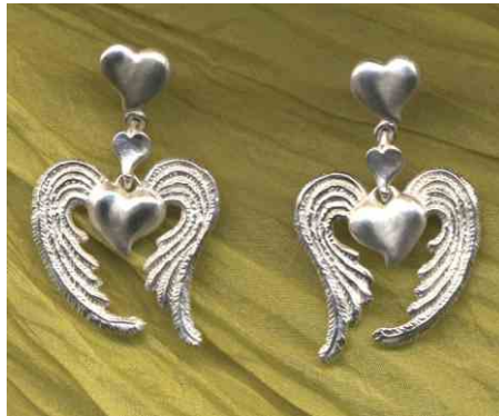
Ohrhänger Herztrio Silber Paar € 440,- auch einzeln