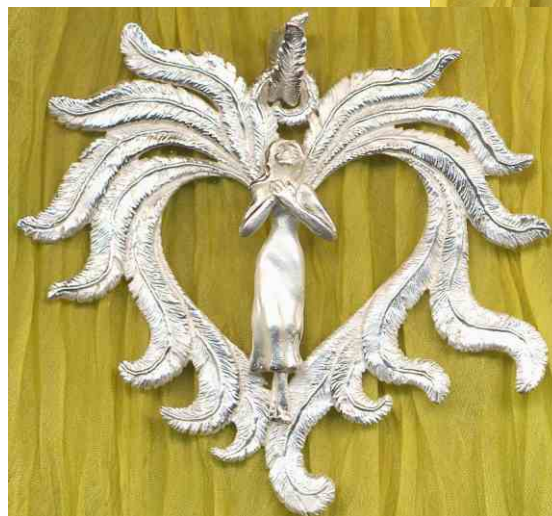
Anhänger Herzensgebet Silber € 390,-