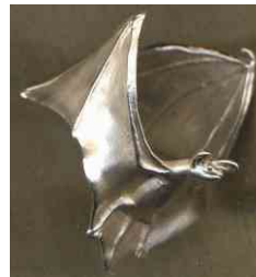
Ring Langohr Silber € 290,-