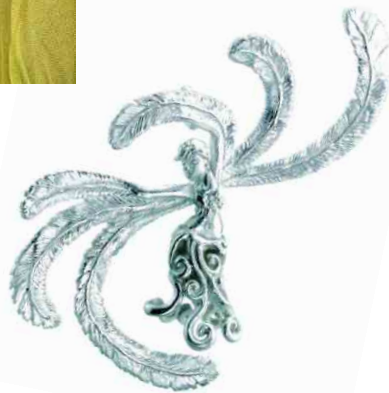
Anhänger Himmelstänzerin Silber € 310,-