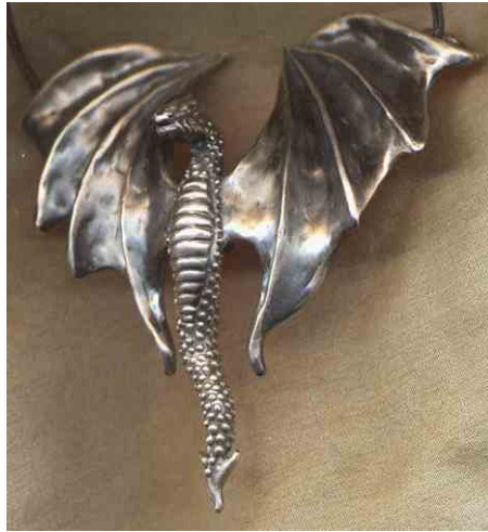
Anhänger Wächter Silber € 360,-