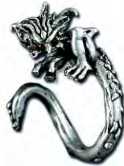
Ring Kleiner Fiesling Silber € 290,-