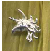
Anhänger Einhorn micro Silber € 90,-