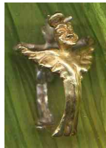
Ring Engel und Teufel Silber € 275,-