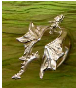
Ring Wellendrache Silber € 320,-