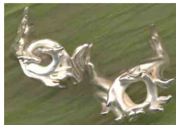
Ringe Drachenmann & Drachenfrau Silber jeweils € 290,-