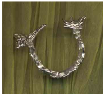
Ring Kleiner Falter Silber € 290,-