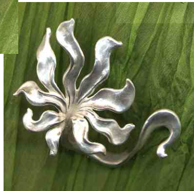
Ring Blütenmeer Silber € 290,-