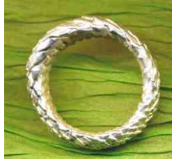
Ring Drachenhaut Silber € 290,-