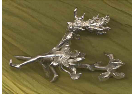
Anhängers Frühlingsbotin Silber € 360,-