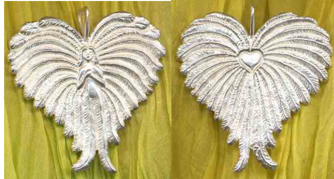
Anhänger Herzengel Silber € 230,-