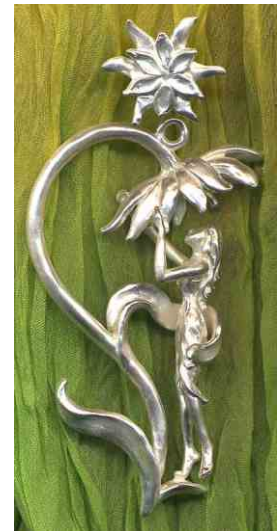
Anhänger Die Sinnliche Silber € 310,-