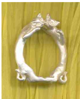
Ring Spielende Kätzchen Silber € 270,-