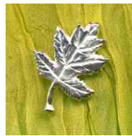
Anhänger Miniblatt Silber € 95,-