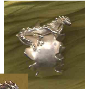
Ring Sonnenleguan Silber € 340,-