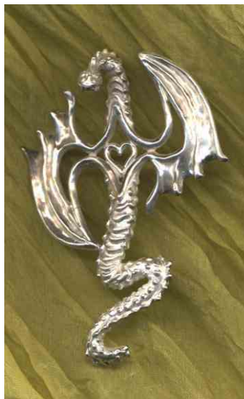
Anhänger Drachenglück Silber € 330,-