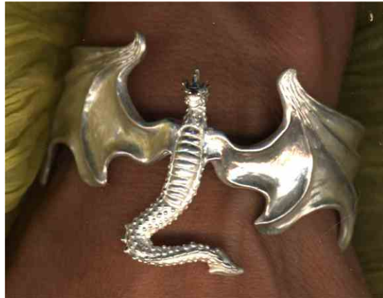
Armspange Zu den Sternen! Silber € 490,-