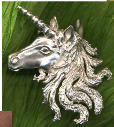
Ring Einhorn Silber € 390,-