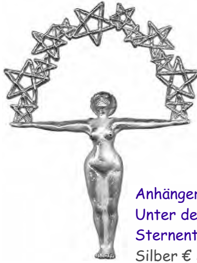
Anhänger Unter dem Sternentor Silber € 360,-