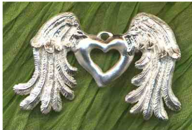
Anhänger Höhenflug Silber € 250,-