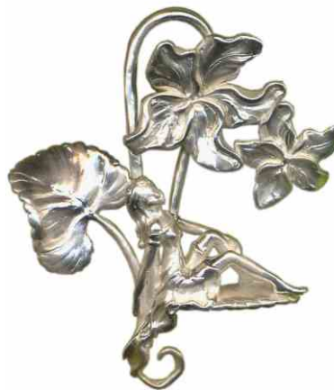
Anhänger Die Hingebungsvolle Silber € 360,-