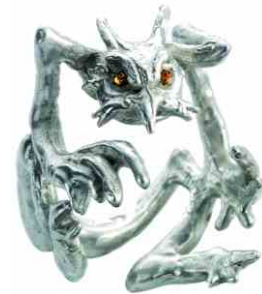
Ring Auf der Lauer Silber € 310,-