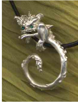
Anhänger Kleiner Fiesling Silber € 290,-