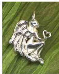
Anhänger Wünsch Dir was! Silber € 120,-