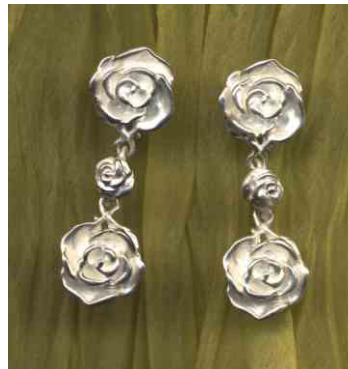
Ohrstecker Rosentrio Silber € Paar 440,-