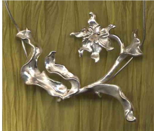
Anhänger Blumenphantasie Silber € 290,-