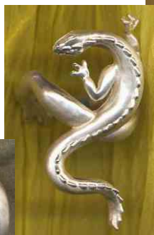
Ring Echse Silber € 280,-