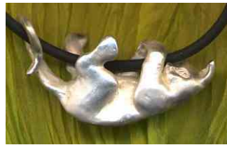
Anhänger Kätzchen Silber € 250,-