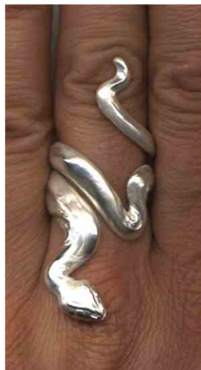
Ring Große Schlange Silber € 310,-