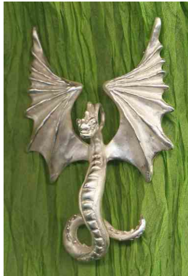
Anhänger Torhüter Silber € 280,-