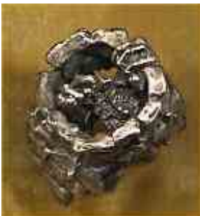
Ring Brunnenkind Silber € 290,-