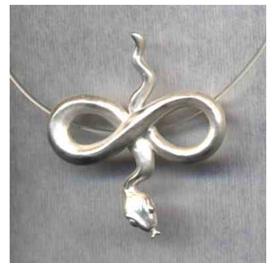
Anhänger Liegende Acht Silber € 230,-