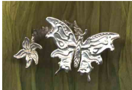
Ring Blütenschmetterling Silber € 340,-