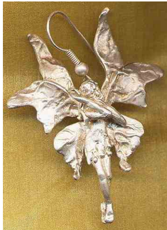
Ohrhänger Elfe Silber € 270,-