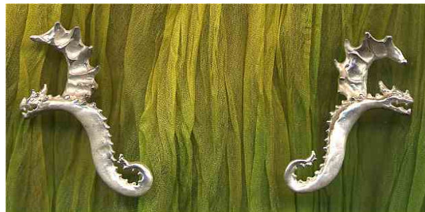
Ohrstecker Rosendrachen Silber € Paar 240,- auch einzeln