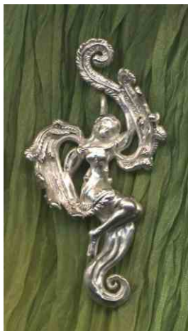
Anhänger Engel Silber € 330,-