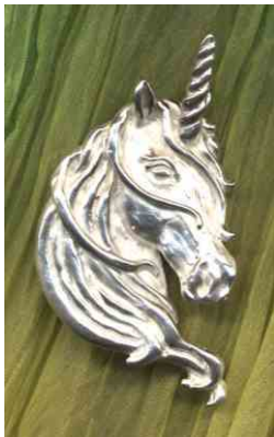
Anhänger Einhorntraum Silber € 300,-