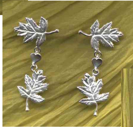
Orhänger Elsbeerherz Silber Paar € 360,-