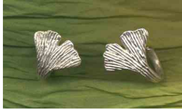
Ohrstecker Ginkgo Silber Paar € 200,-