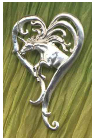
Anhänger Herzensweg Silber € 290,-