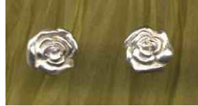
Ohrstecker Rosentraum Silber Paar € 170,-