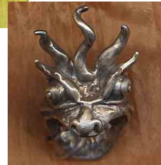
Ring Gierhals Silber € 310,-