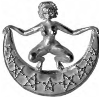
Anhänger Mama Luna Silber € 380,-