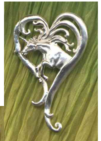
Anhänger Herzensweg Silber € 290,-