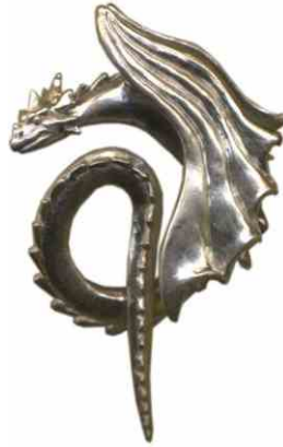
Anhänger Drachenspeer Silber € 330,-