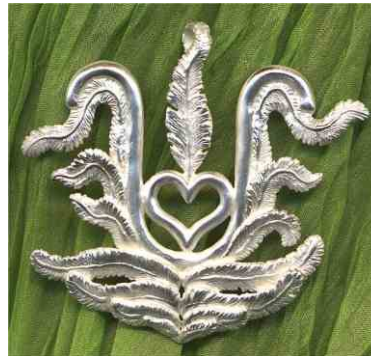
Anhänger Elexier Flügel Silber € 320,-