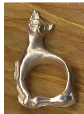
Ring Katzendame Silber € 280,-