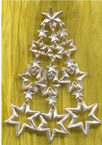
Ohrhänger Sternenregen Silber € 400,-