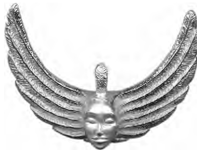
Anhänger Mondsüchtig Silber € 290,-