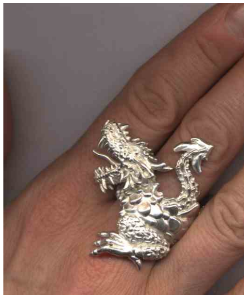
Ring Hausdrache Silber € 390,-