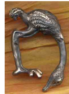
Ring Vogel Strauß Silber € 280,-