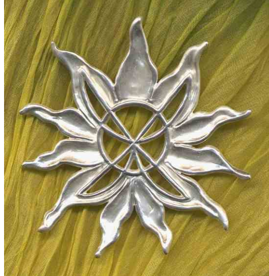
Anhänger Sonnenstrahl Silber € 330,-