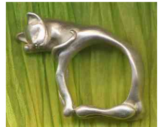
Ring Schmusekatze Silber € 280,-