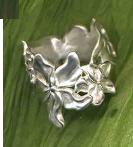
Ring Frühlingsduft Silber € 340,-