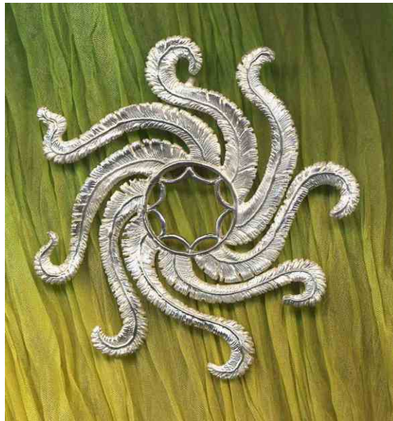
Anhänger Sonnenrad Silber € 390,-