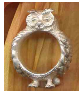
Ring Eule Silber € 320,-