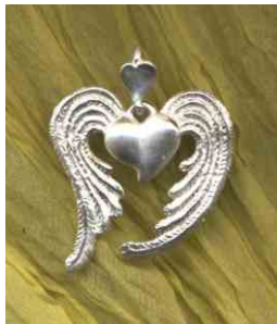
Anhänger Himmelhoch Silber € 130,-