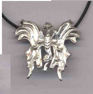
Anhänger Schmetterlingsdrache Silber € 250,-