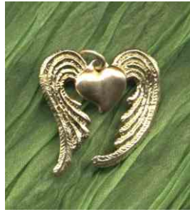
Anhänger Himmelhoch siehe bei Herzen