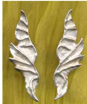
Ohrstecker Elfenflügel Silber Paar € 240,- auch einzeln