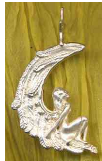
Anhänger Mondengel Silber € 210,-