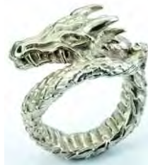
Ring Drago Silber € 350,-