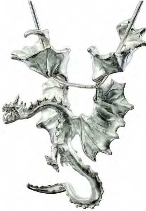
Anhänger Drache Silber € 470,-