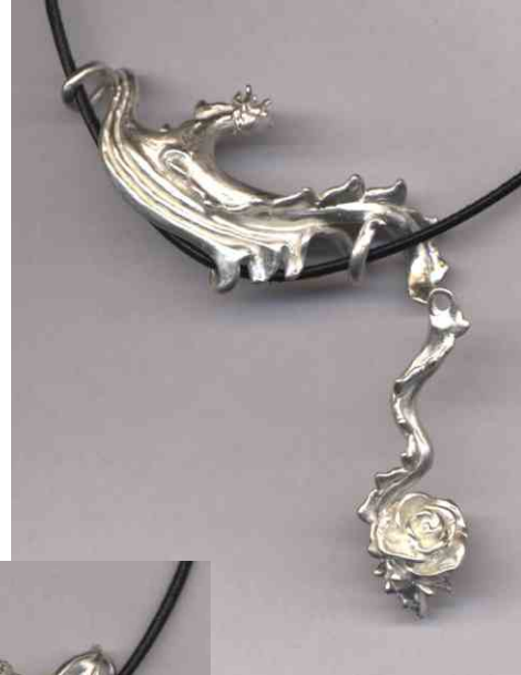
Anhänger Rosendrache Silber € 300,-