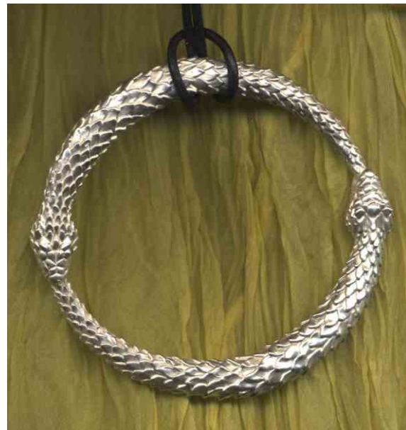
Anhänger Never give up! Silber € 440,-