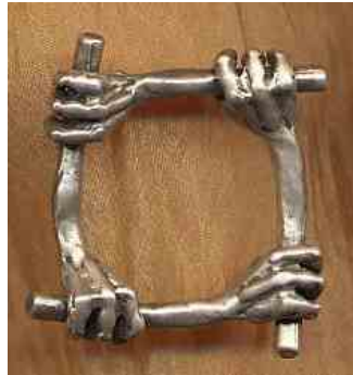
Ring Vier Hände Silber € 240,-