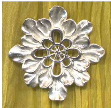
Anhänger Erbühend Silber € 320,-