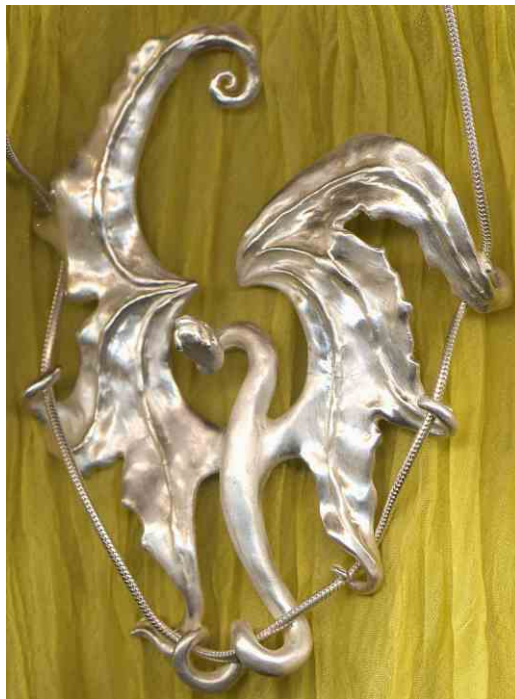
Anhänger Flammenflügel Silber € 470,-