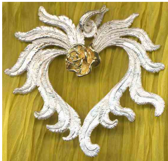
Anhänger Rosenherz Siehe bei Herzen