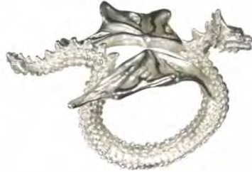
Ring Achtäugiger Drache Silber € 340,-