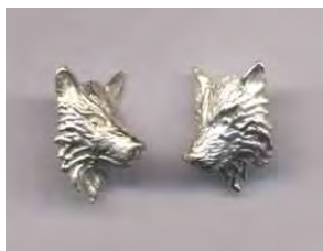
Ohrstecker Wolf Silber Paar € 240,-