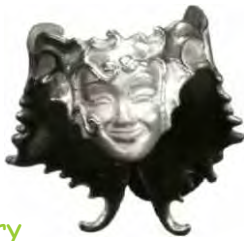
Ring Butterfly Fairy Silber € 300,-