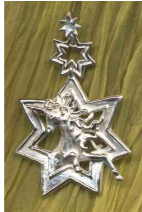
Anhänger Sternenfunke Silber € 330,-