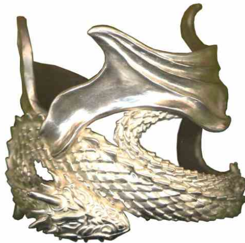
Armspange Drache Silber € 880,-