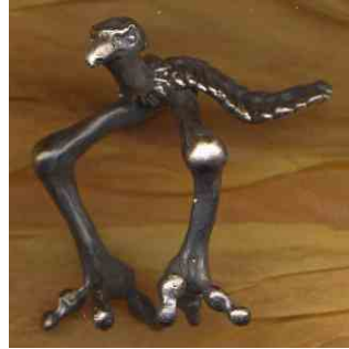
Ring Geyer Silber € 290,-