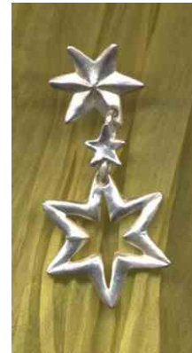
Ohrhänger 3 Sterne Silber € 150,-