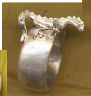
Ring Leguan Silber € 350,-