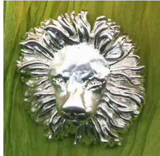
Anhänger Löwe Silber € 320,-