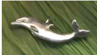
Anhänger Kleiner Delphin Silber € 100,-