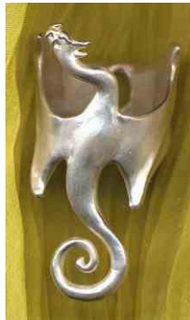
Ring Spiraldrache Silber € 270,-