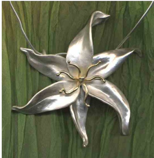
Anhänger Himmelsblüte Silber € 380,- auch bicolor