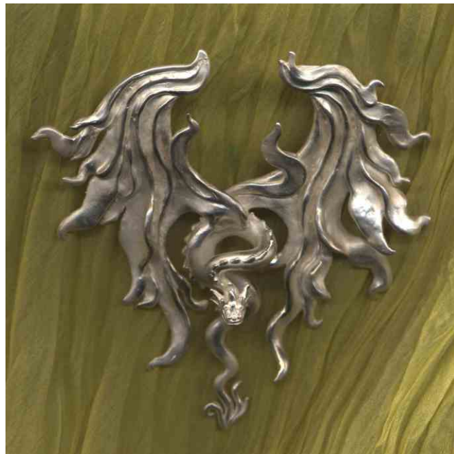
Anhänger Kreiger des Lichts Silber € 460,-