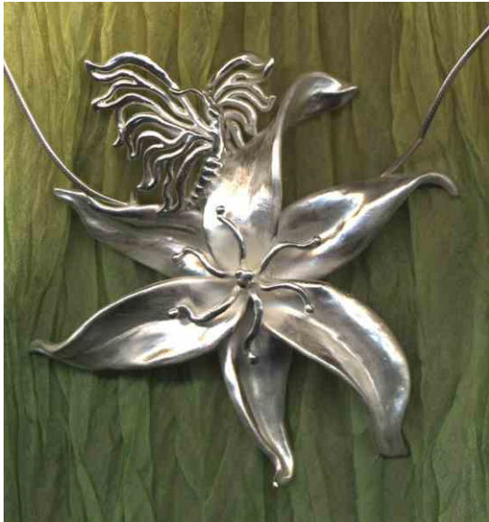
Anhänger Schmetterlingsblüte Silber € 440,-