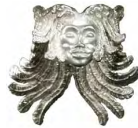
Ring Vogelfee Silber € 320,-