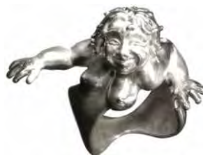
Ring Mama Terra Silber € 340,-