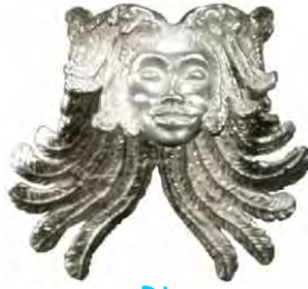
Ring Vogelfee Silber € 320,-