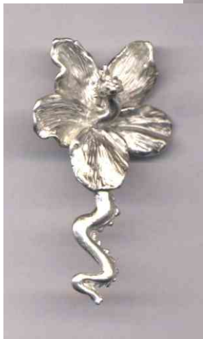
Anhänger Blumendrache Silber € 250,-