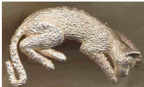
Ring Katze Silber € 420,-