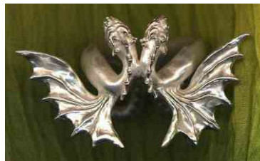
Ring Barockdrachen Silber € 310,-