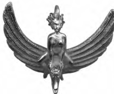
Anhänger Mondreiterin Silber € 380,-