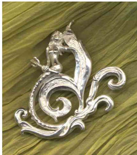
Anhänger Kleine Meeresgöttin Silber € 360,-