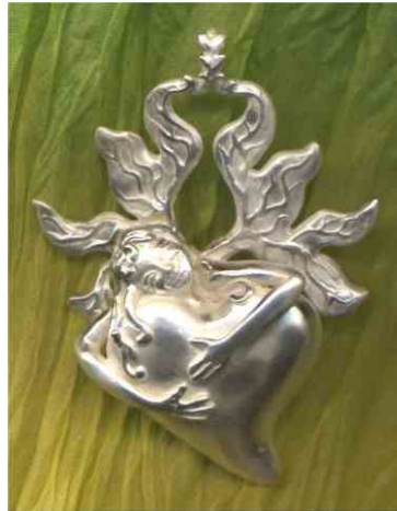
Anhänger Verliebt ins Leben Silber € 330,-