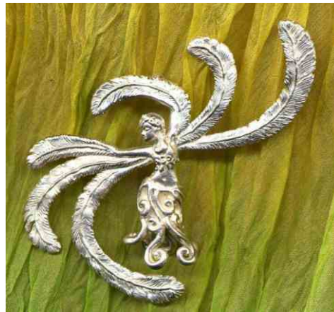
Anhänger Himmelstänzerin Silber € 310,-