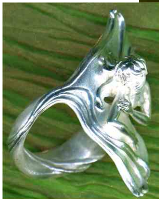
Ring Blütensee Silber € 310,-