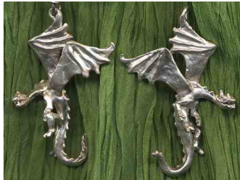
Ohrhänger Flugdrache Silber pro Stück € 210,-