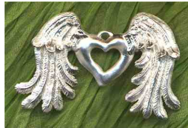
Anhänger Höhenflug Silber € 250,-