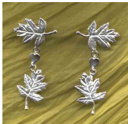
Ohrhänger Elsbeerherz Silber Paar € 360,-