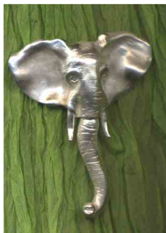
Anhänger Elephantenrüssel Silber € 300,-