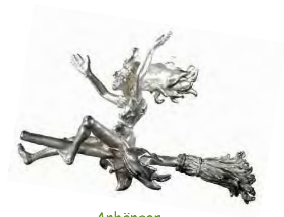
Anhänger Kräuterhexe Silber € 360,-