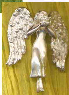
Anhänger Rosenengel Silber € 280,-