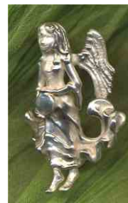
Anhänger Lichtengel Silber € 270,-