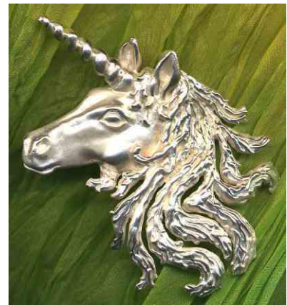
Anhänger Einhorn Silber € 290,-