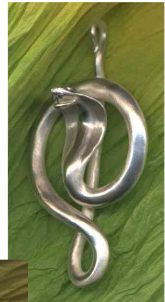
Anhänger Kobra Silber € 360,-