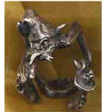
Ring Carpe Diem et Noctem Silber € 310,-