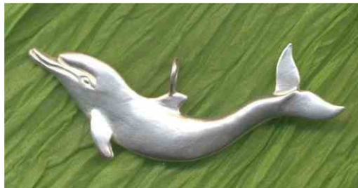
Anhänger Wie ein Fisch im Wasser Silber € 230,-