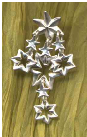
Ohrhänger 9 Sterne Silber € 230,-