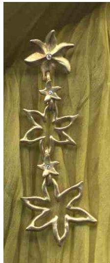
Ohrhänger Sternenblume Silber € 210,-