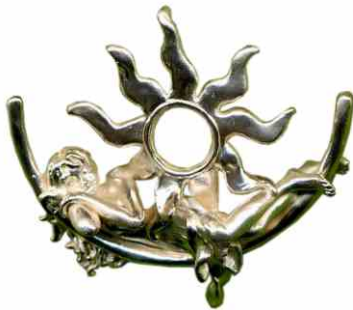
Anhänger Sonnenkind Silber € 360,-