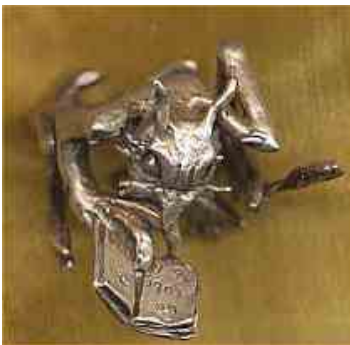
Ring Wortklau Silber € 320,-