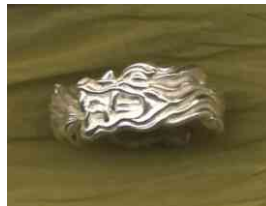
Ring Wasser- und Feuerdrache Silber € 310,-