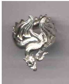
Ring Treuer Begleiter Silber € 285,-