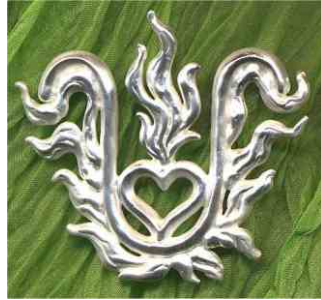
Anhänger Flammenelexier Silber € 270,-