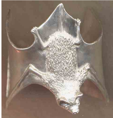
Armspange Kleiner Abendsegler Silber € 880,-