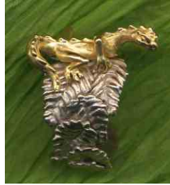
Ring Blätterleguan siehe bei Animals