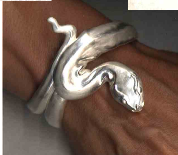
Armspange Schlange Silber € 790,-