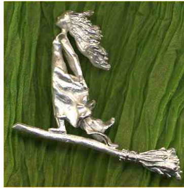
Anhänger Traumwandlerin Silber € 270,-