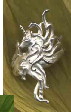
Ring Träumendes Einhorn Silber € 310,-