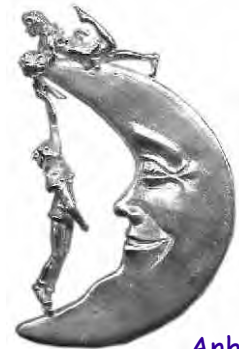
Anhänger Honeymoon Silber € 300,-