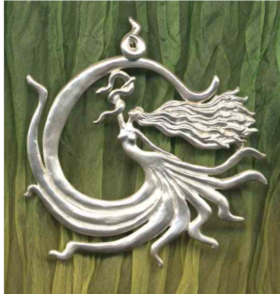
Anhänger Hüterin des Windes Silber € 370,-