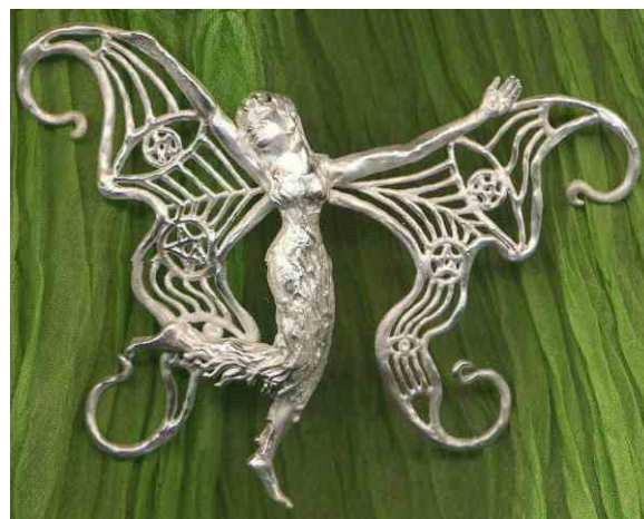
Anhänger Tanzende Elfe