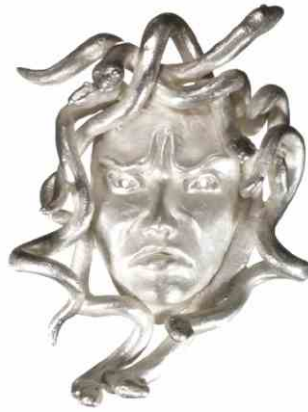
Anhänger Medusa Silber € 360,-