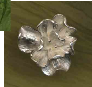
Ring Blütenpracht Silber € 340,-