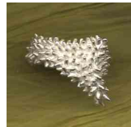
Ring Stachelschuppe Silber € 320,-