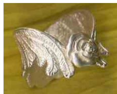
Ring Rosenfee Silber € 290,-