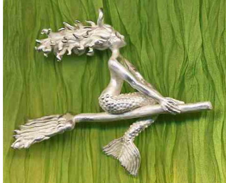
Anhänger Nexe Silber € 340,-