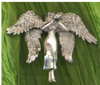
Anhänger Betender Engel Silber € 360,-