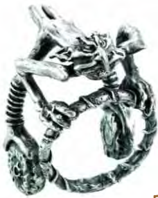
Ring Fahrschüler Silber € 320,-