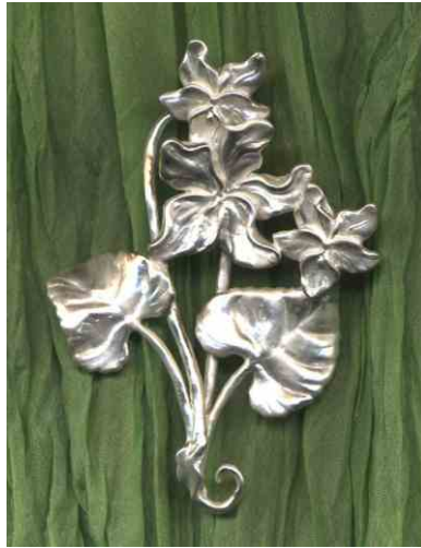
Anhänger Frühlingsduft Silber € 310,-