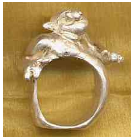
Ring Stumpfsinn Silber € 330,-