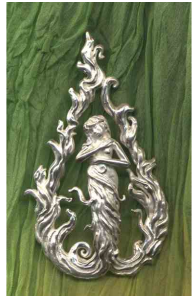
Anhänger Hüterin des Feuers Silber € 370,-