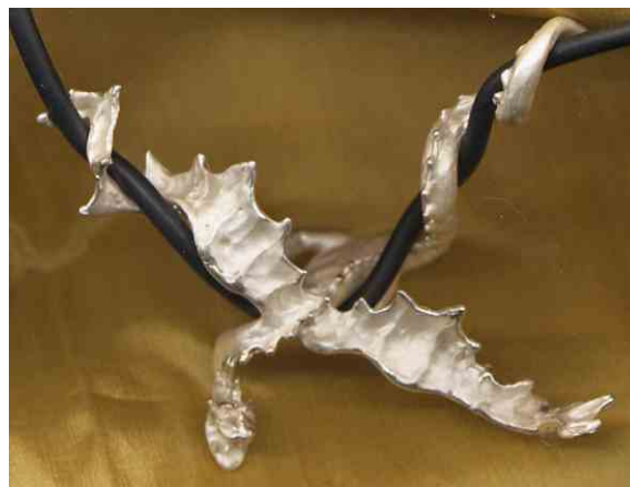
Anhänger Winddrache Silber € 360,-