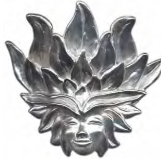
Ring Flammenblume Silber € 310,-