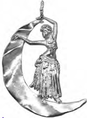
Anhänger Mondtanz Silber € 310,-