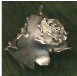
Ring Sonnenrose Silber € 350 auch bicolor,-