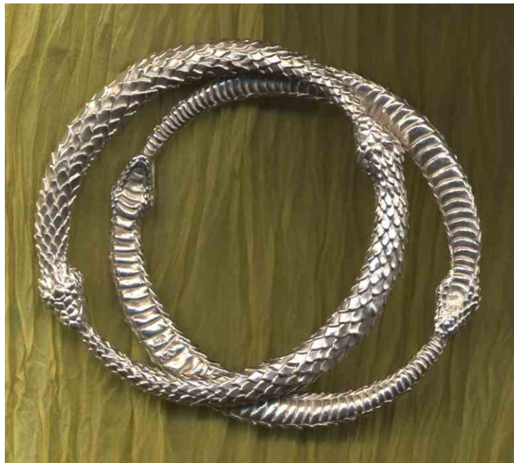
Armreif Never Give Up!