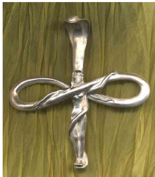
Anhänger Hüterin der Kundalini Silber € 350,-