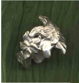
Ring Veilchen Silber € 310,-