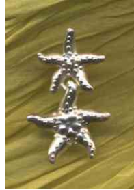
Ohrstecker Zwei Seesterne Silber € 170,-