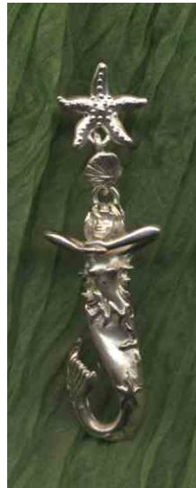
Ohrstecker Miss Ocean Silber € 260,-