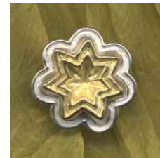
Anhänger Sternenblüte bicolor Preis auf Anfrage!