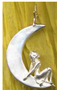
Anhänger Mondmädchen Silber € 190,-