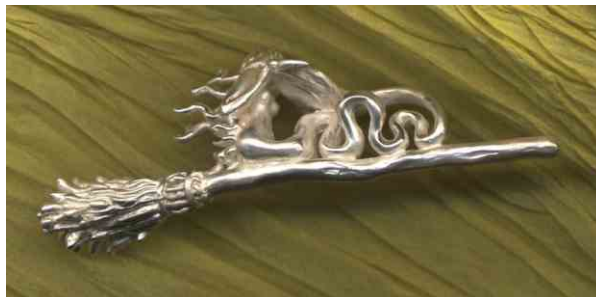
Anhängers Hups! Silber € 310,-