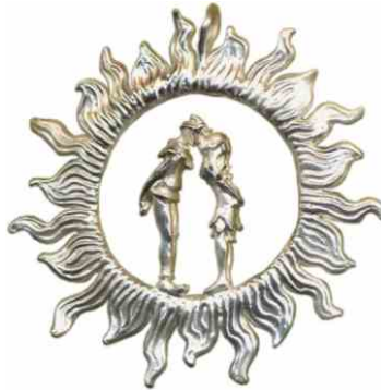
Anhänger Die Liebenden