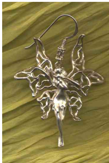
Ohrhänger Luftelfe Silber € 270,-