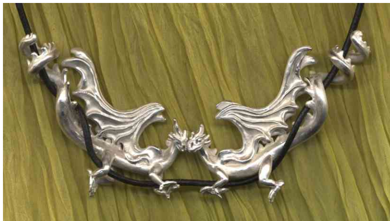
Anhänger Drachsamkeit Silber € 480,-