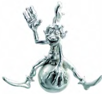
Anhänger Endorphinus Silber € 310,-