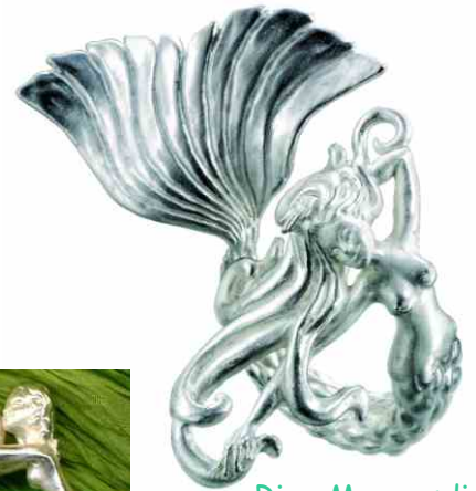
Ring Meeresdiva Silber € 350,-