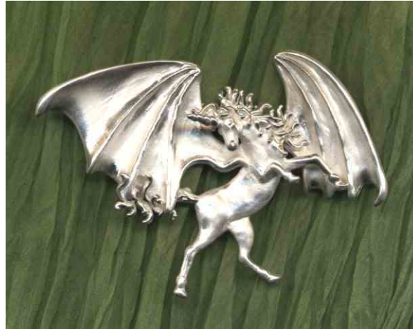
Anhänger Einhorn der Lüfte Silber € 360,-