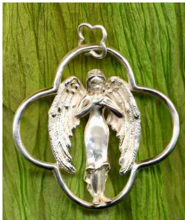
Anhänger Dankbarkeit Silber € 390,-