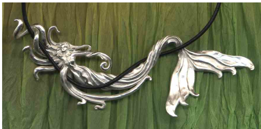
Anhänger Meereswooge Silber € 370,-