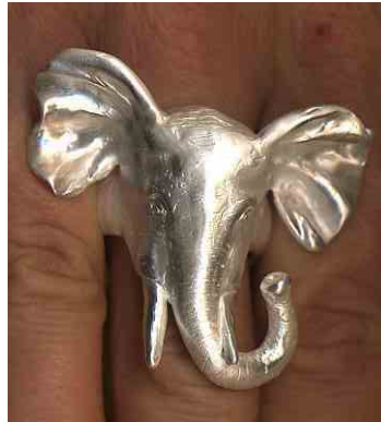
Ring Elephantenkopf Silber € 370,-