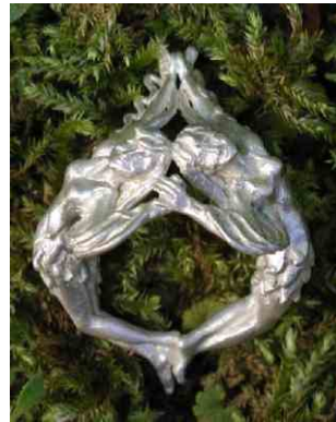
Ring Elfentanz Silber € 300,-