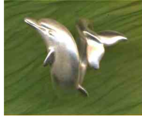
Ring Wie ein Fisch im Wasser Silber € 260,-