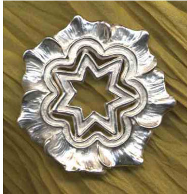
Anhänger Blütenstern Silber € 330,-