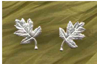
Ohrstecker Elsbeerblatt Silber Paar € 200,-