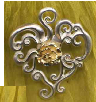
Anhänger Rosenlaube Silber € 270,- auch bicolor