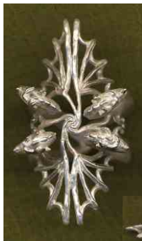
Ring Drachenquarée Silber € 290,-