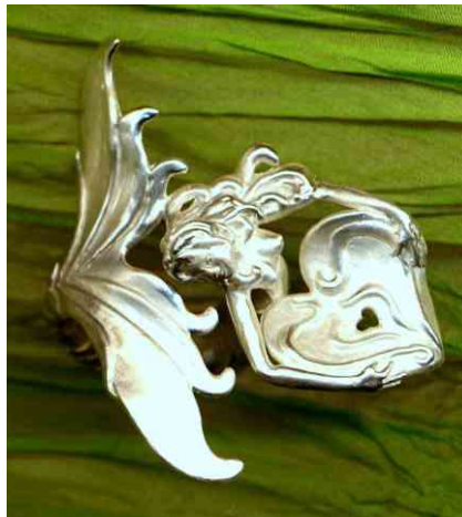
Ring Open Haert Silber € 340,-