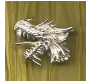
Anhänger Feel Free! Silber € 300,-