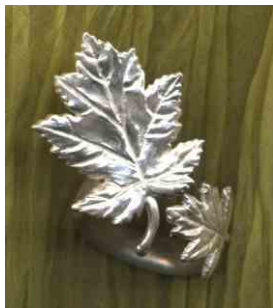
Ring Zwei Blätter Silber € 290,-