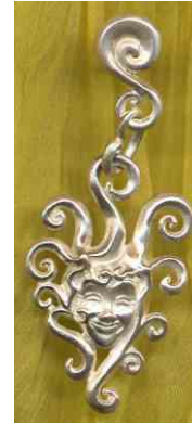
Ohrhänger Little Princess Silber € 250,-