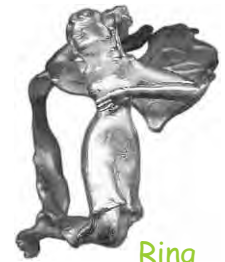
Ring Schleiermond Silber € 320,-