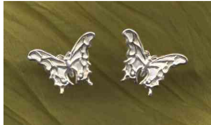
Ohrstecker Schmetterling Silber Paar € 220,-