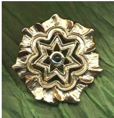
Anhänger Blütenstern siehe bei Florales