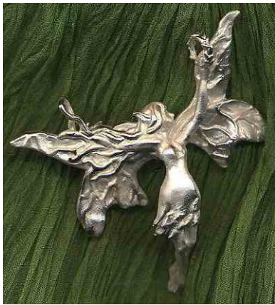
Anhänger Windelfe Silber € 290,-