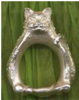
Ring Kater Silber € 390,-