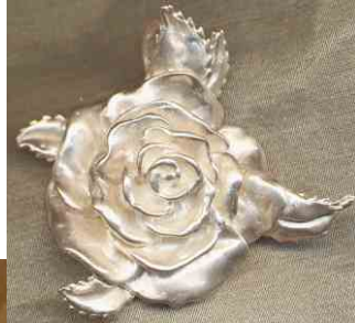
Anhänger Blätterrose Silber € 260,-