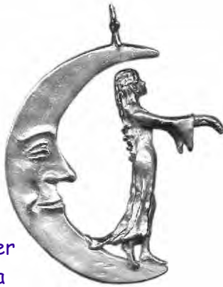
Anhänger La Luna Silber € 310,-