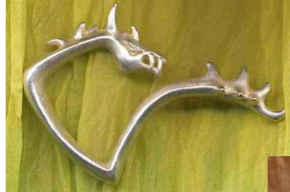
Ring Verdandi Silber € 250,-