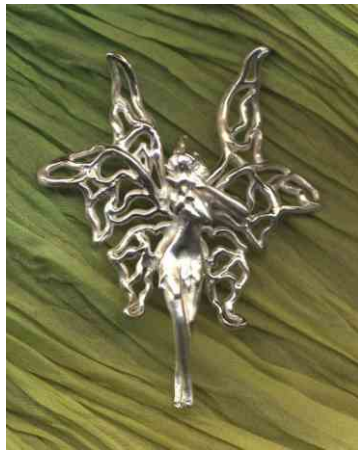
Anhänger Luftelfe Silber € 270,-