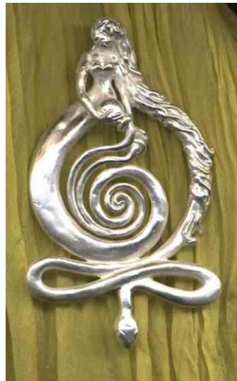
Anhänger Harmonie Silber € 360,-