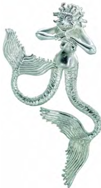
Anhänger Meerhexe Silber € 380,-