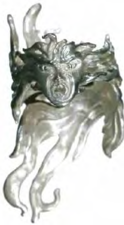
Ring Feuerzauber Silber € 320,-