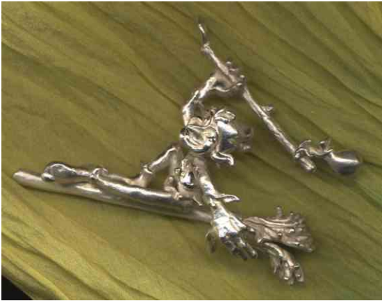
Anhänger Reine Freude Silber € 350,-