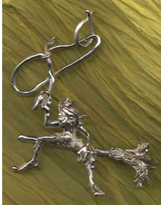
Anhänger Schlangenwerfer Silber € 360,-