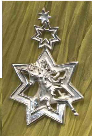
Anhänger Sternenfunke Silber € 330,-