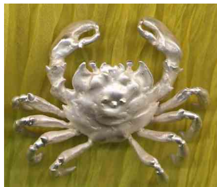
Anhänger Krebs Silber € 340,-