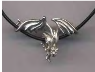
Anhänger Draufgänger Silber € 125,-