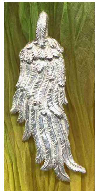
Anhänger Engelsflügel Silber € 350,-