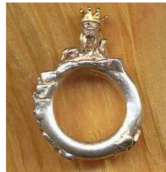
Ring Froschkönig Silber € 310,-