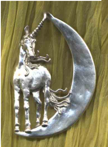
Anhänger Mondeinhorn Silber € 350,-