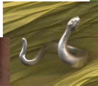
Ring Schlange Silber € 240,-