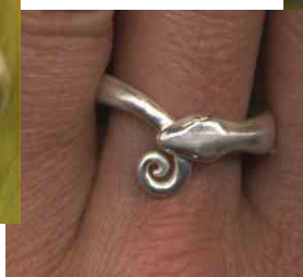
Ring Uroboros Spirale Silber € 190,-