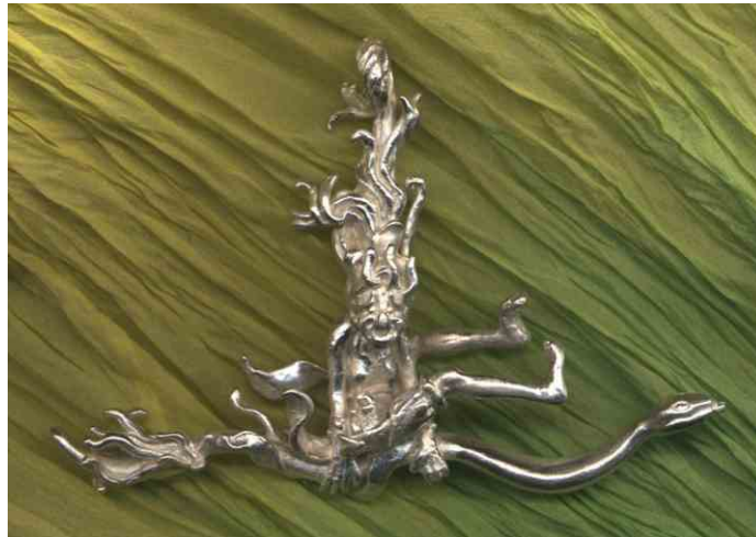
Anhängers Schlangenbesen Silber € 370,-