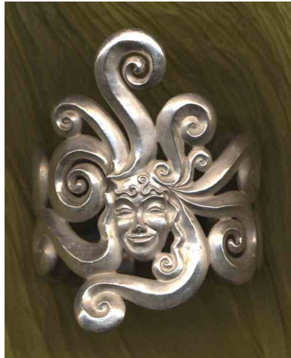
Armspange Little Princess Silber € 880,-