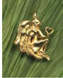
Anhänger Wünsch Dir was! siehe bei Engelwesen