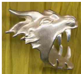
Ring Der Hungrige Silber € 290,-