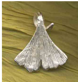
Anhänger Ginkgo Silber € 180,-