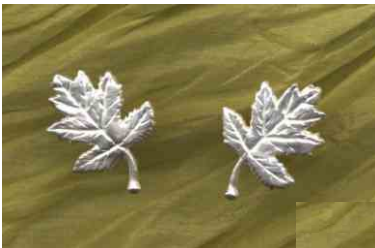
Ohrstecker Elsbeerblatt Silber Paar € 200,-