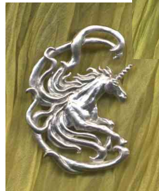
Anhänger Himmelsstürmer Silber € 290,-