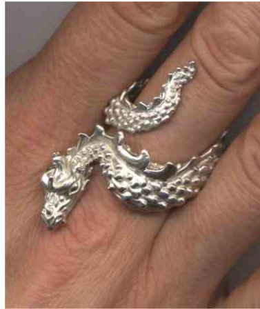
Ring Schlangendrache Silber € 355,-