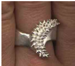
Ring Drachenschwanz Silber € 280,-