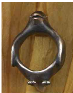
Ring Pinguin Silber € 290,-