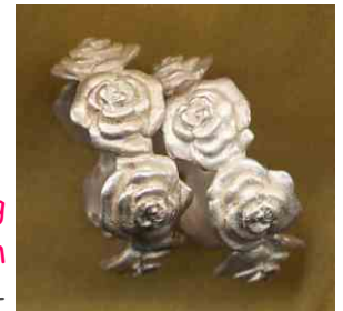
Ring Rosentraum Silber € 260,-