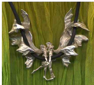
Anhänger Elfentanz Silber € 470,-