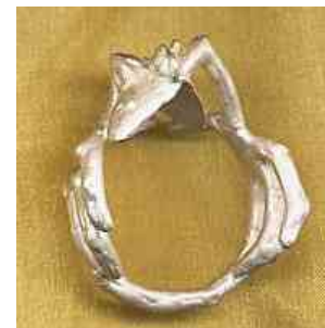
Ring Frechdachs Silber € 190,-