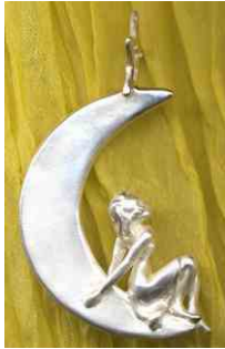
Anhänger Mondmädchen Silber € 190,-