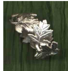
Ring Elsbeerbouquet Silber € 320,-