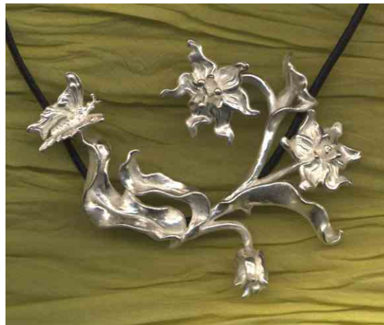
Anhänger Schmetterlingsphantasie Silber € 340,-