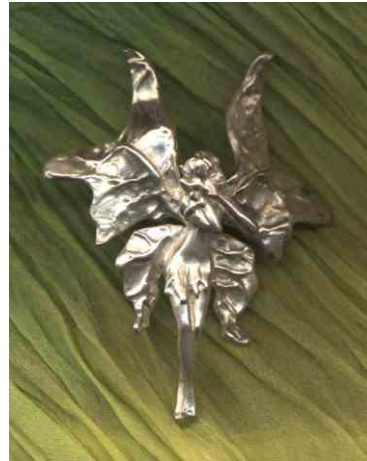
Anhänger Blumenelfe Silber € 270,-