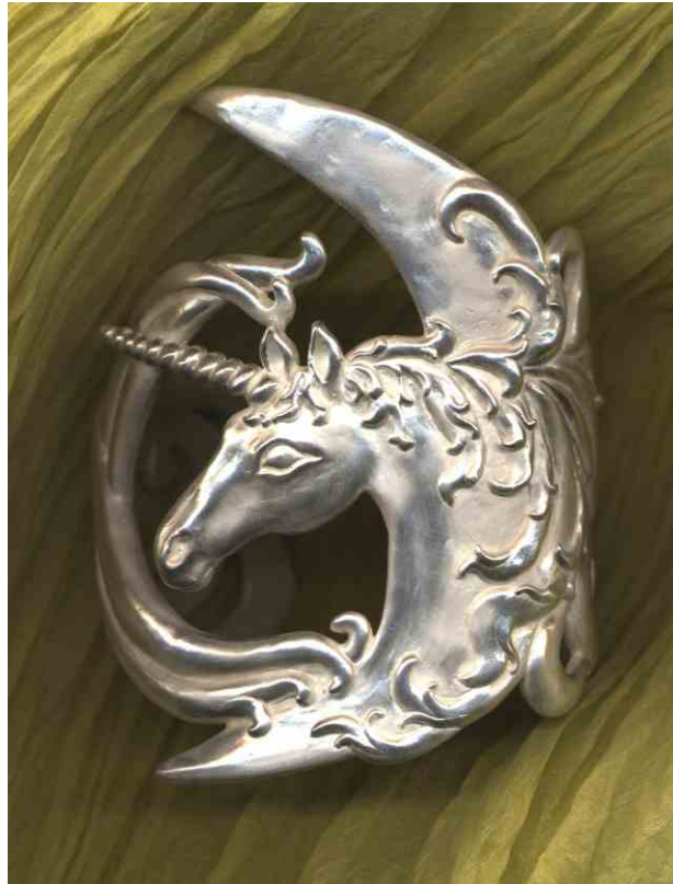
Armspange Mondeinhorn Silber € 880,-