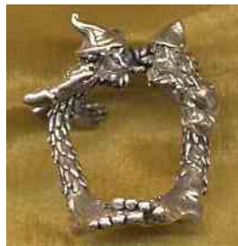
Ring Streithammel Silber € 320,-