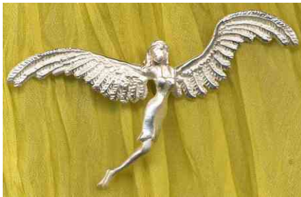
Anhänger Feenflug Silber € 240,-