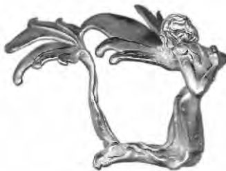
Ring Mondblüte Silber € 330,-