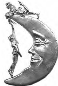
Anhänger Honeymoon Silber € 300,-