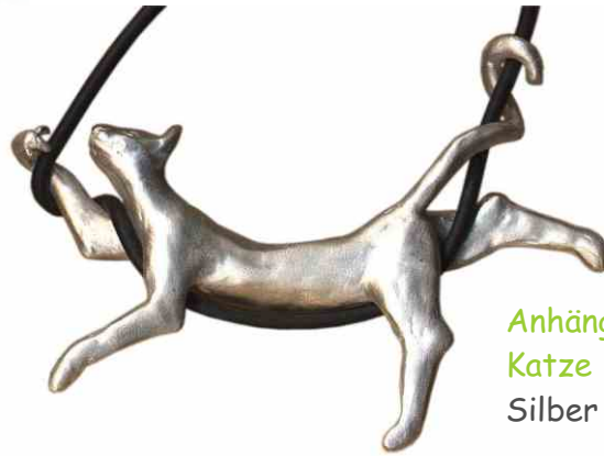
Anhänger Katze Silber € 320,-