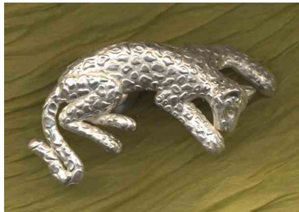
Ring Panther Silber € 420,-