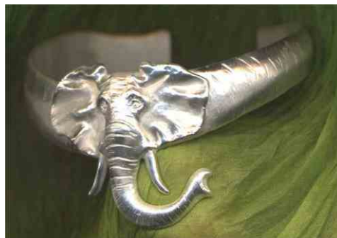
Armspange Elephant Silber € 390,-