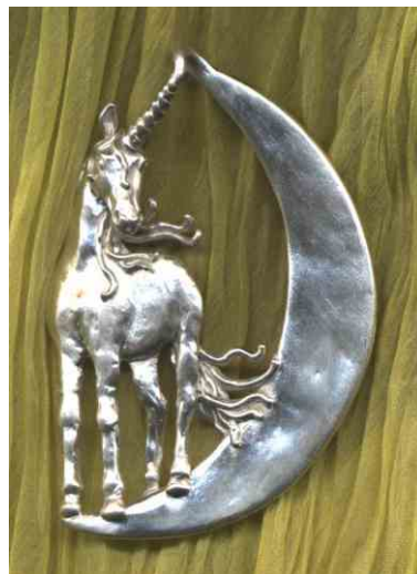
Anhänger Mondeinhorn Silber € 350,-