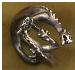
Ring Bruder Drache Silber € 260,-