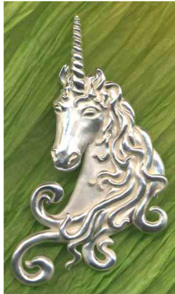
Anhänger Die Kraft der Sanftmut Silber € 360,-