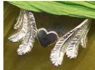
Ring Liebe verleiht Flügel Silber € 280,-