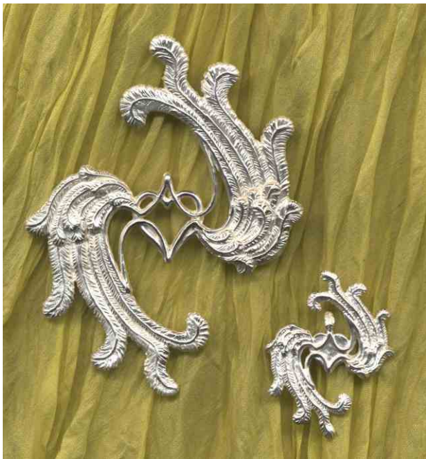
Anhänger Voller Liebe! groß Silber € 380,- klein Silber € 160,-