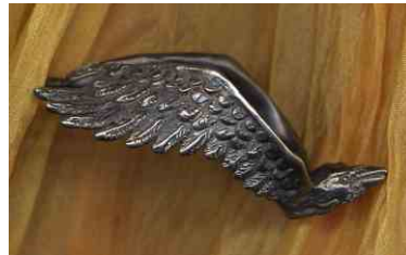
Ring Der Geflügelte Silber € 250,-