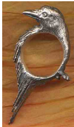
Ring Rabe Silber € 330,-