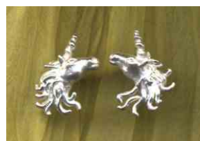
Ohrstecker Einhorn Silber Paar € 210,-