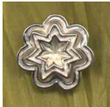
Anhänger Sternenblüte Silber € 240,-