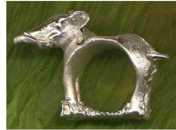
Ring Elephant Silber € 350,-