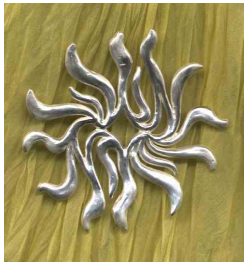
Anhänger Ornament Silber € 320,-