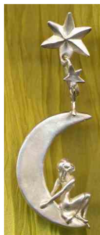
Ohrhänger Mondmädchen Silber € 250,-