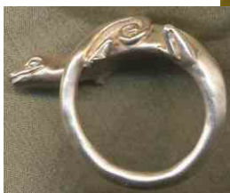
Ring Gecko Silber € 250,-