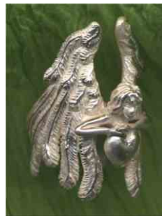
Ring Schutzengel Silber € 320,-