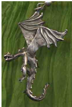
Anhänger Flugdrache Silber € 210,-