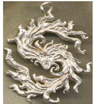
Anhänger Feuerzauber Silber € 360,-