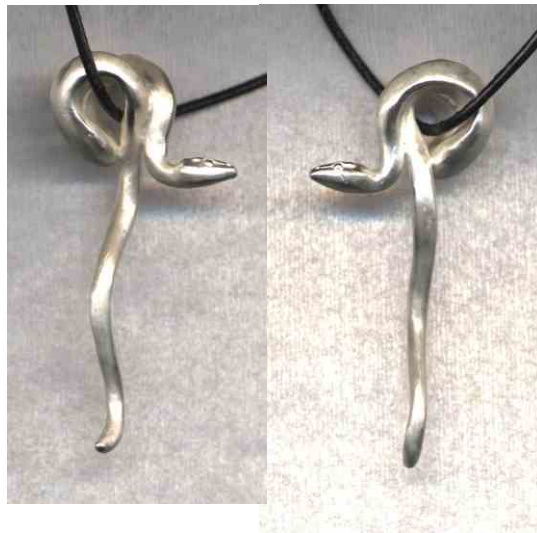
Anhänger Schlange, hängend Silber € 240,-