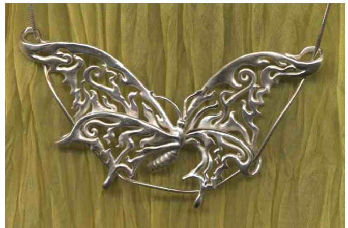
Anhänger Schmetterling Silber € 340,-