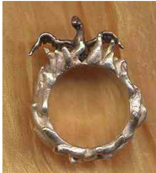
Ring Phönix aus der Asche Silber € 320,-