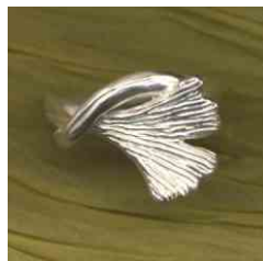
Ring Ginkgo Silber € 230,-