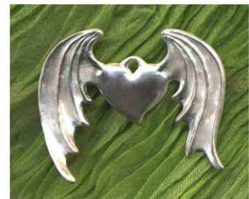
Anhänger Herzensfreiheit Silber € 190,-