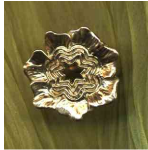
Ring Blütenstern siehe bei Florales