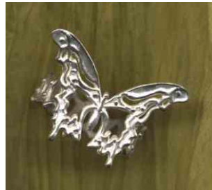
Ring Schmetterlingsart Silber € 270,-