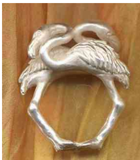
Ring Flamingos Silber € 330,-