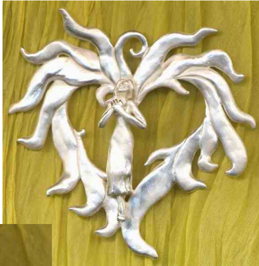
Anhänger Flammendes Herz Silber € 370,-