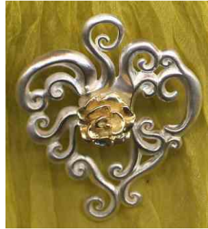
Anhänger Rosenlaube siehe bei Herzen