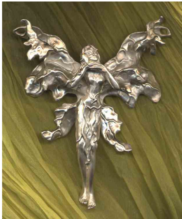
Anhänger Elfenkönigin Silber € 600,-