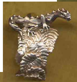
Ring Blätterleguan Silber € 350,-