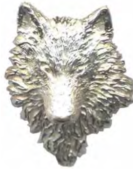
Anhänger Wolf Silber € 370,-