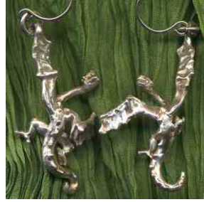
Ohrhänger Schatzhüter Silber € 240,- auch einzeln