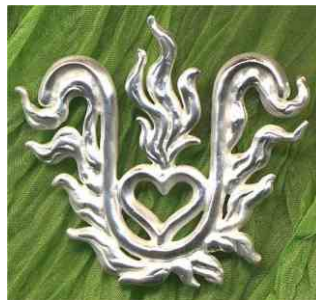
Anhänger Elexier Flamme Silber € 260,-