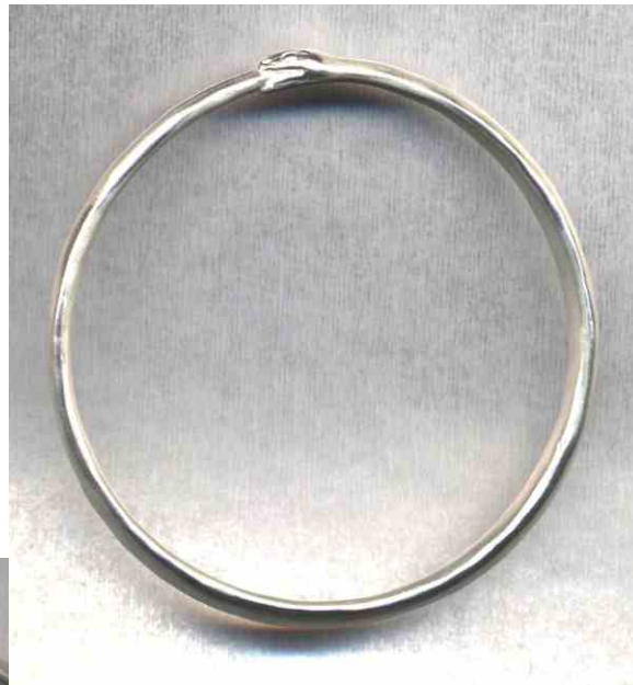
Armreif Schlange, gerade Silber € 300,-