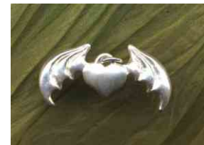
Anhänger Freiheit Silber € 90,-