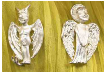
Manschettenknöpfe Engel und Teufel Silber Paar € 420,-