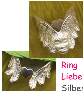
Ring Liebe verleiht Flügel Silber € 280,-