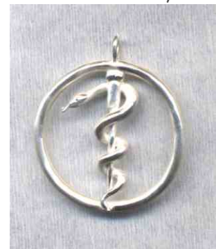
Anhänger Äskulapstab Silber € 210,-