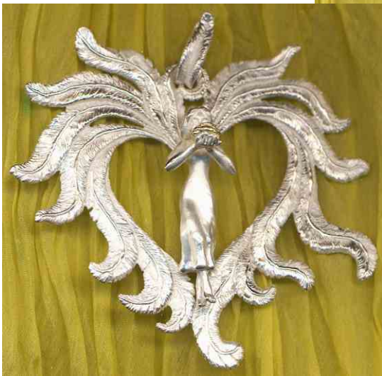
Anhänger Rosenduft Silber € 390,-