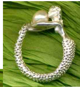
Ring Perljungfrau Silber € 330,-