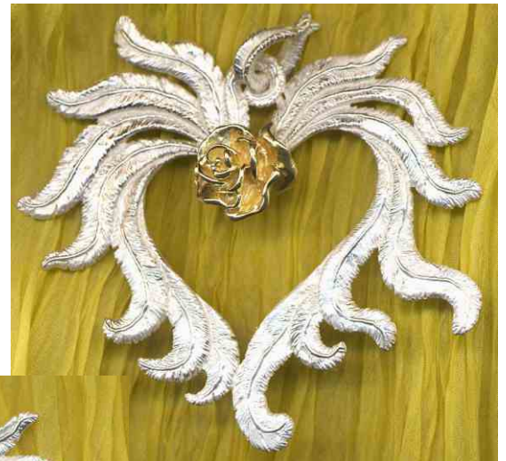
Anhänger Rosenherz Silber € 350,- auch bicolor