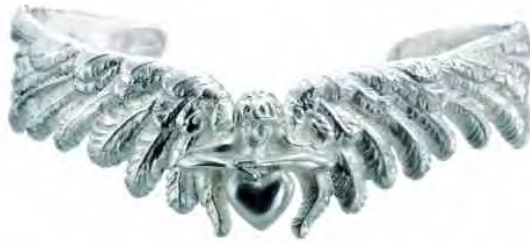
Armspange Schutzengel Silber € 420,-