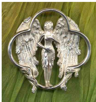
Anhänger Das Geschenk Silber € 380,-