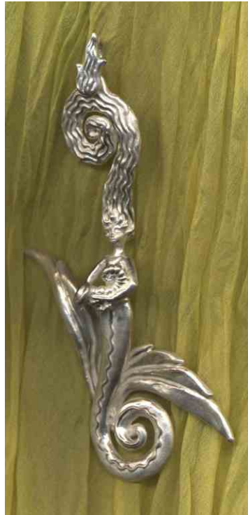
Anhänger Hüterin des Wassers Silber € 350,-