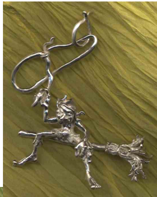
Anhänger Schlangenwerfer Silber € 360,-