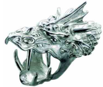
Ring Lindwurm Silber € 440,-