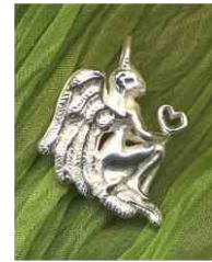
Anhänger Wünsch Dir was! Silber € 120,-