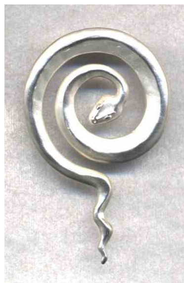
Anhänger Schlangenspirale Silber € 300,-