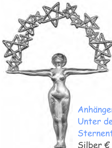
Anhänger Unter dem Sternentor Silber € 360,-