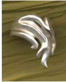
Ring Feuer und Flamme Silber € 280,-