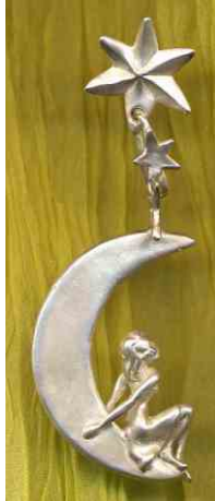
Ohrhänger Mondmädchen Silber € 250,-