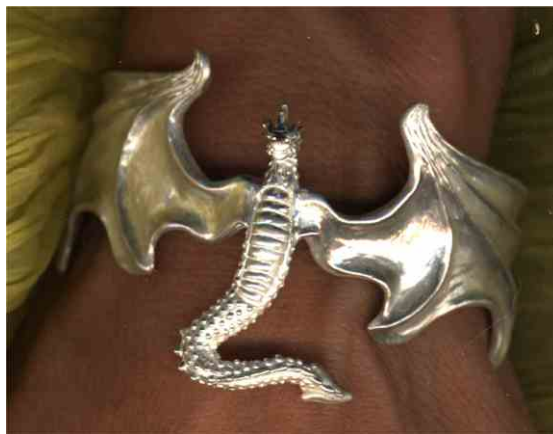
Armspange Zu den Sternen! Silber € 490,-