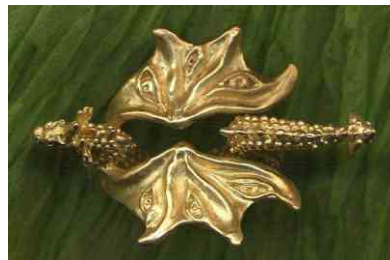
Ring Achtäugiger Drachen siehe bei Drachen-Ringe