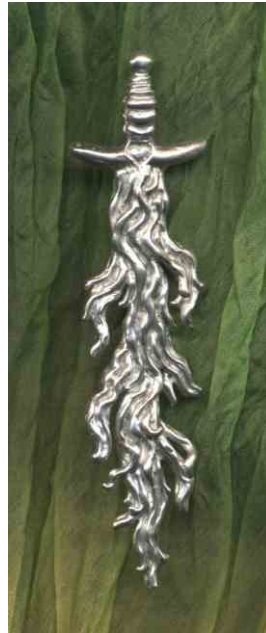
Anhänger Feuerschwert Silber € 320,-