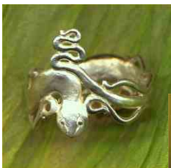
Ring Sonnenschlange Silber € 210,-