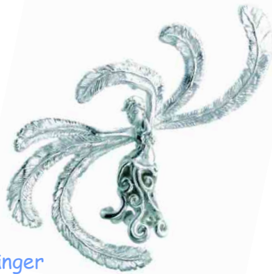
Anhänger Himmelstänzerin Silber € 310,-