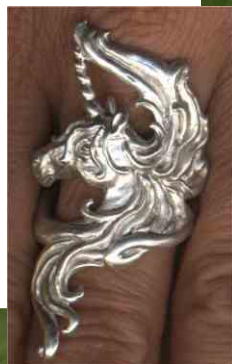
Ring Mondmähne Silber € 320,-