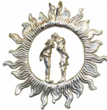
Anhänger Die Liebenden Silber € 290,-