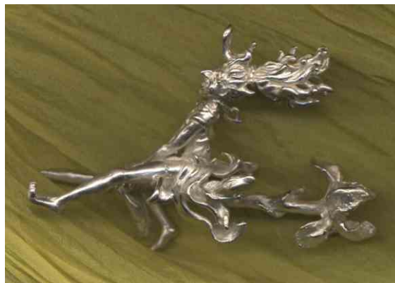
Anhänger Frühlingsbotin Silber € 360,-