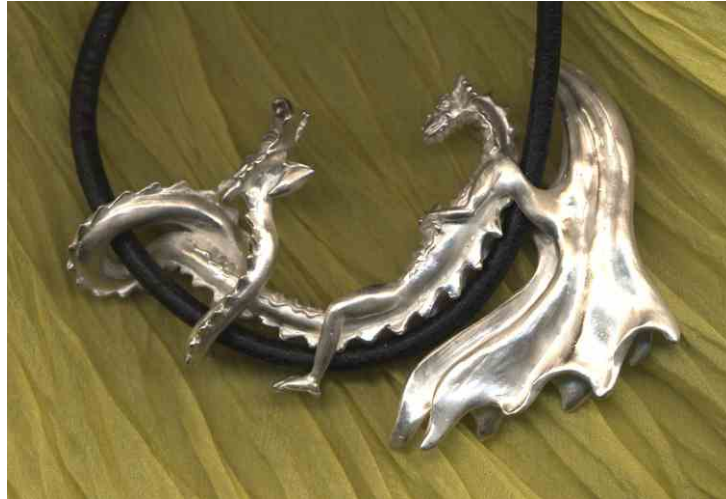
Anhänger Dragoschmetterlingowitsch Silber € 495,-