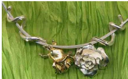
Anhänger Rosenranke siehe bei Rosen