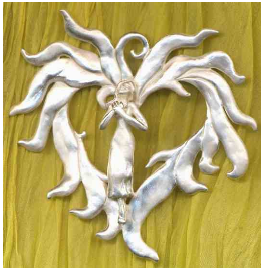
Anhänger Flammendes Herz Silber € 370,-