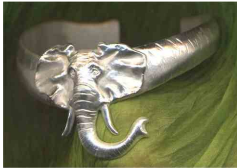
Armspange Elefant Silber € 390,-