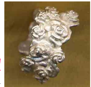
Ring Rosenbouquet Silber € 320,-