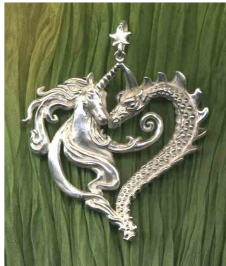
Anhänger Einhorn & Drache Silber € 360,-