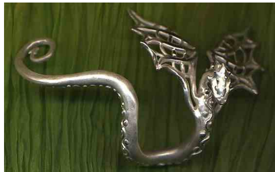
Ring Ritterdrache Silber € 360,-