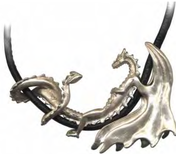
Anhänger Relax Silber € 460,-