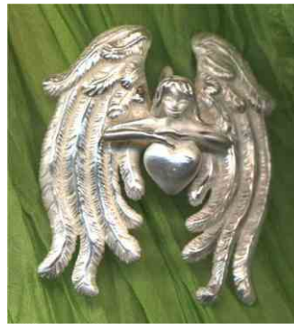
Anhänger Schutzengel Silber € 330,-