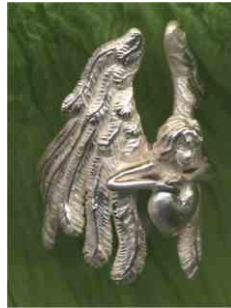
Ring Schutzengel Silber € 320,-