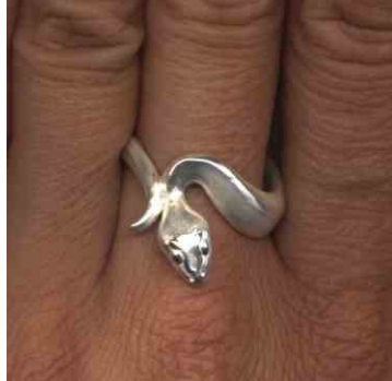
Ring Kleine Schlange Silber € 230,-