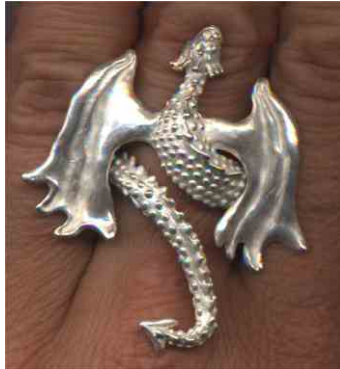
Ring Zu den Sternen! Silber € 350,-