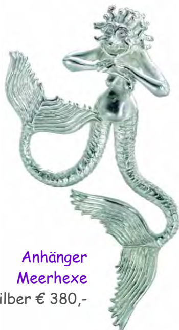
Anhänger Meerhexe Silber € 380,-