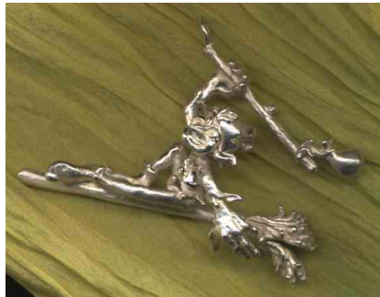
Anhänger Reine Freude Silber € 350,-