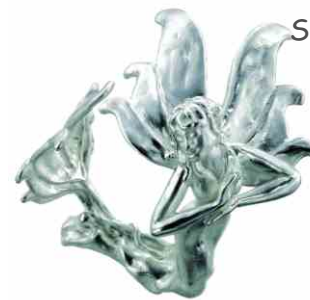
Ring Blütenschwester Silber € 320,-