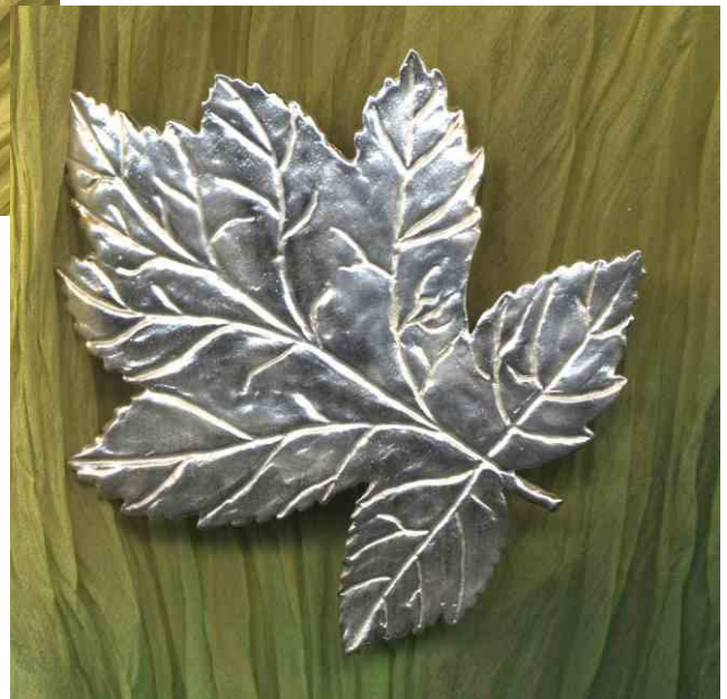
Gürtelschliesse Elsbeerblatt Silber € 520,-