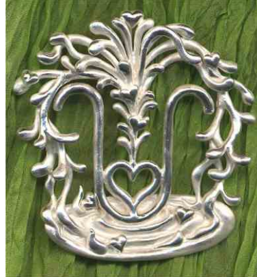
Anhänger Elexier Fontäne Silber € 360,-