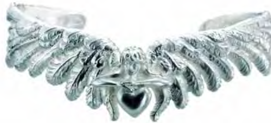
Armspange Schutzengel Silber € 420,-