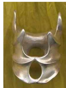
Ring Drachenflügel Silber € 270,-