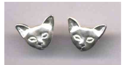
Ohrstecker Katzenkopf Silber Paar € 220,-