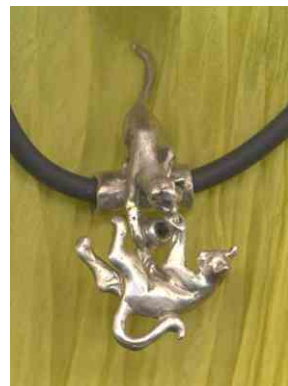
Anhänger Spielende Kätzchen Silber € 290,-