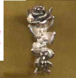
Ring Blätterrose Silber € 280,-