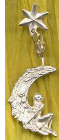
Ohrhänger Mondengel Silber € 270,-