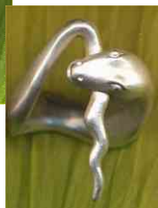
Ring Uroboros Welle Silber € 210,-