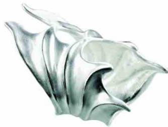
Ring Drachenschwinge Silber € 320,-