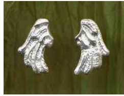
Ohrstecker Kleine Flügel