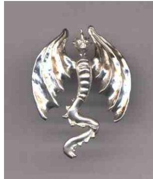
Anhänger Treue Seele Silber € 180,-