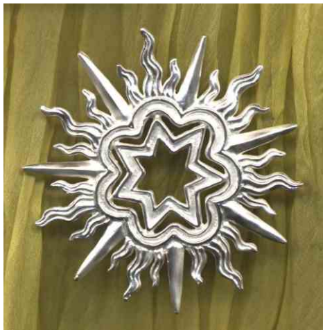
Anhänger Klingende Flamme Silber € 370,-