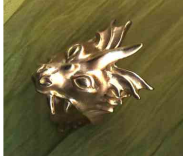
Ring Der Hungrige siehe bei Drachen-Ringe