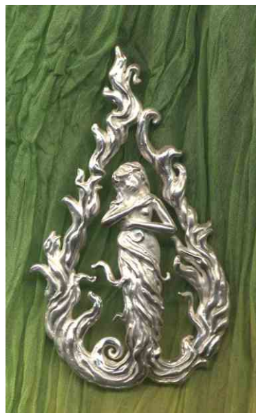
Anhänger Hüterin des Feuers Silber € 370,-