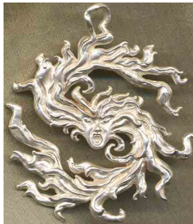
Anhänger Feuerzauber Silber € 360,-