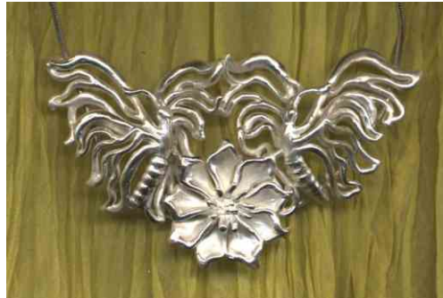
Anhänger Blumenfalter Silber € 470,-