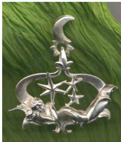
Anhänger Traumblüte Silber € 350,-