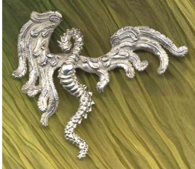
Anhänger Drachenengel Silber € 440,-