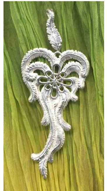
Anhänger Herzenswunsch Silber € 330,-