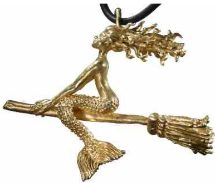
Anhänger Nexe Silber € 340,-