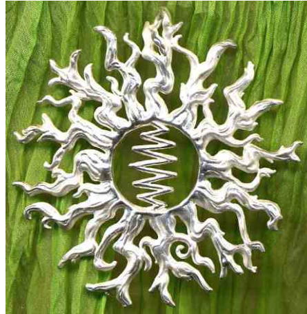
Anhänger Quelle des Lichts