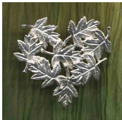
Anhänger Elsbeerherz Silber € 280,-