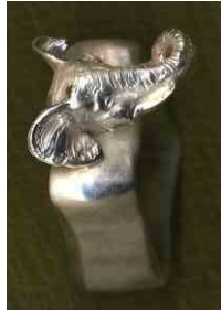
Ring Animal Elephant Silber € 320,-