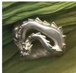
Ring Drachenhort Silber € 280,-