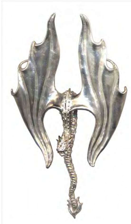
Anhänger Flying Dragon