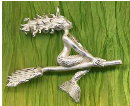
Anhänger Nexe Silber € 340,-