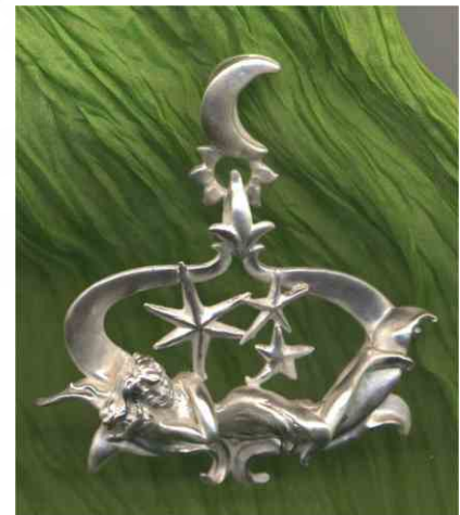
Anhänger Traumblüte Silber € 350,-