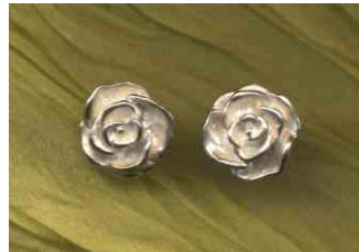
Ohrstecker Rosen Silber Paar € 190,-