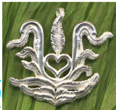
Anhänger Elexier Flügel Silber € 320,-