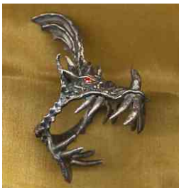
Ring Drachenkopf Silber € 320,-