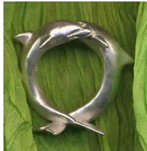
Ring Delphine Silber € 330,-