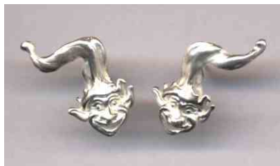
Ohrstecker Enderphinius Silber Paar € 260,-