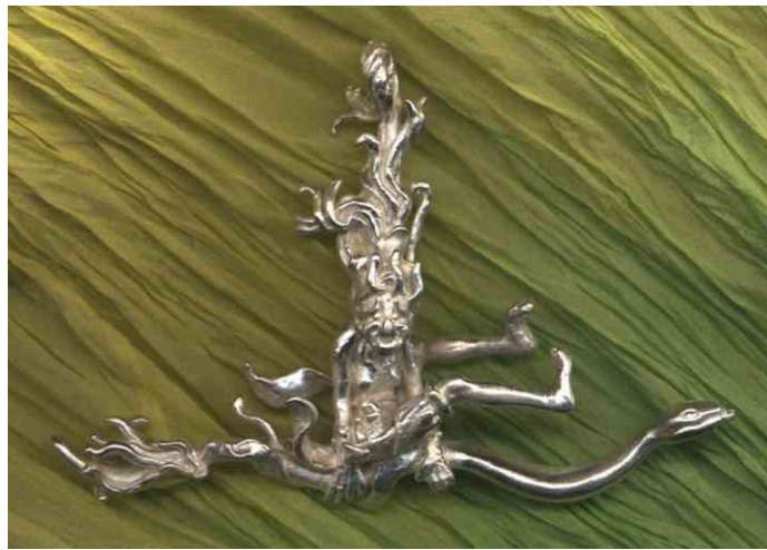
Anhänger Schlangenbesen Silber € 370,-