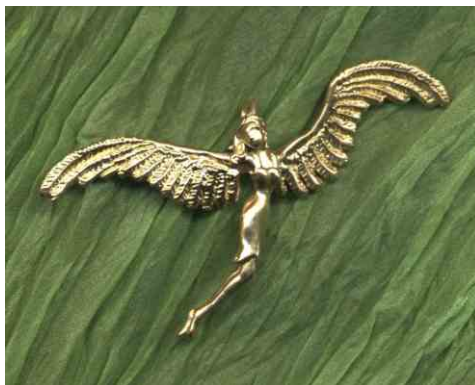
Anhänger Feenflug siehe bei Engelwesen