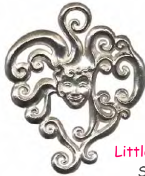
Anhänger Little Princess Heart Silber € 250,-