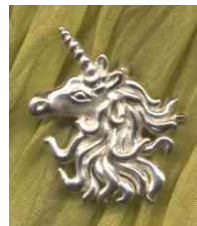
Anhänger Einhorn mini Silber € 110,-