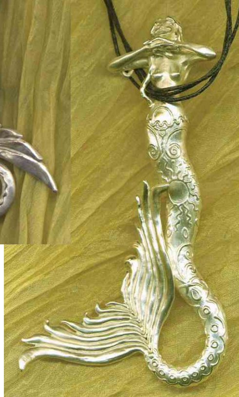
Anhänger Lady Ocean Silber € 410,-