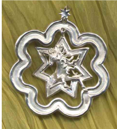
Anhänger Sternensaat Silber € 420,-