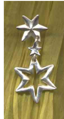
Ohrhänger 3 Sterne Silber € 150,-