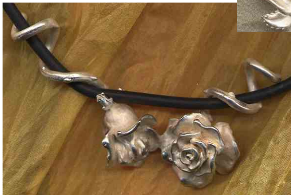
Anhänger Rosenranke Silber € 320,-