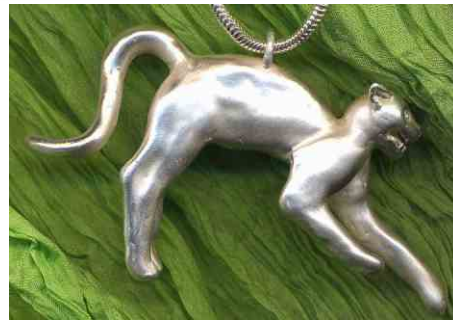
Anhänger Eigensinn Silber € 310,-