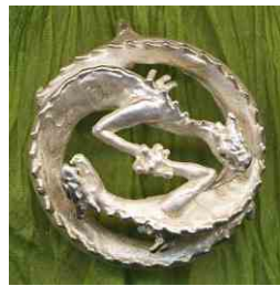
Anhänger Bruder Drache Silber € 260,-