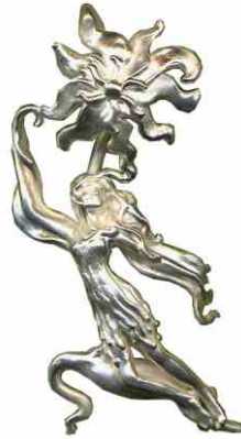
Anhänger Die Tanzende Silber € 280,-