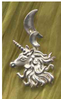
Ohrstecker Mondeinhorn Silber Stück € 230,-