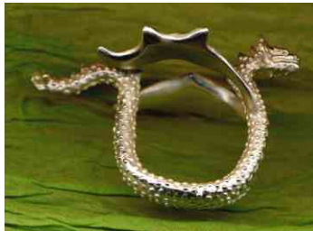
Ring Schuppendrache Silber € 330,-