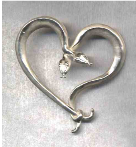
Anhänger Schlangensherz Silber € 290,-