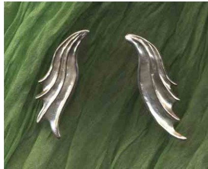
Ohrstecker Drachenflügel Silber Paar € 240,- auch einzeln