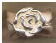
Ring Rose Silber € 260,-