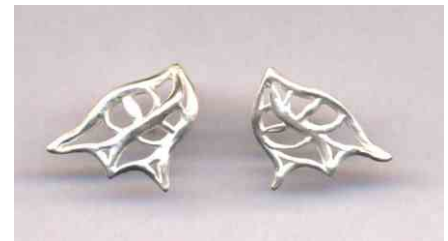
Ohrstecker Ritterdrache Silber Paar € 220,-