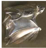
Ring Kleiner Abendsegler Silber € 280,-