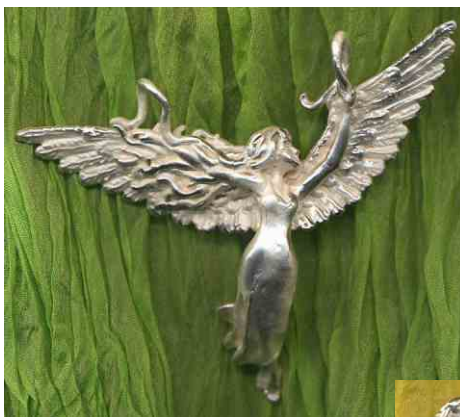
Anhänger Windengel Silber € 270,-