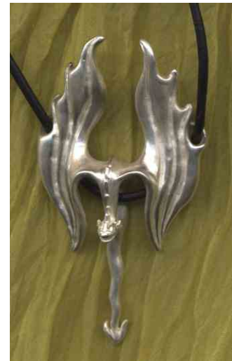
Anhänger Magic Fighter Silber € 260,-