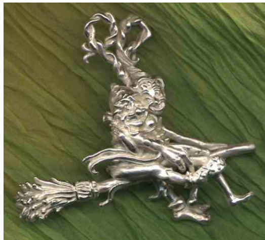
Anhänger Muß Liebe schön sein! Silber € 440,-